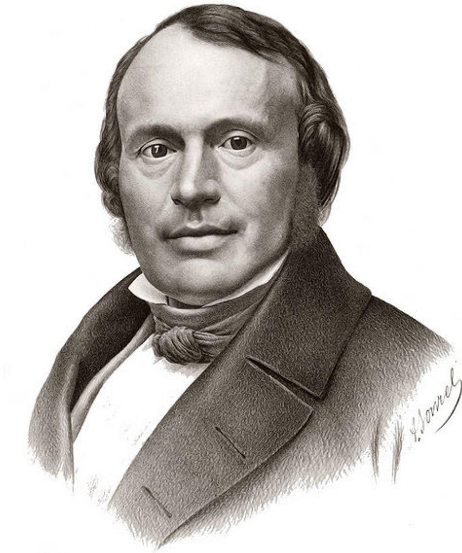
Louis Agassiz. (Bild: Antoine Sorel. wikimedia commons. public domain.)

demonstrieren. Ein Verhalten, dass ihn zu einem verbrecherischen Wissenschaftler machte.