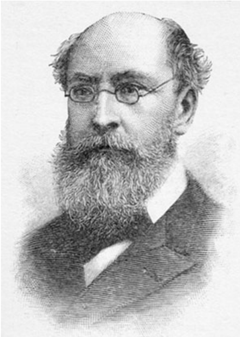
Benjamin A. Gould (27.9.1824-26.11.1896).