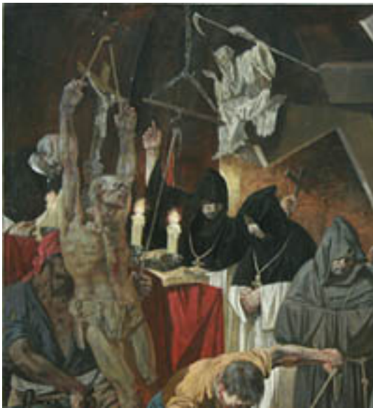
Inquisition (Ilyas Phaizulline)

"Nun, Glückwünsche! Sie haben einen Fehler in einem 650seitigen Lehrbuch gefunden. Schlaumeier. Ein wirklicher Gelehrter, und nicht ein intellektueller Rüpel wie Sie, hätte mir einfach gemailt, dass da ein Fehler im Text sei, hätte entsprechende Quellen angegeben und vorgeschlagen, das zu ändern. Beim nächsten Mal sollten Sie dieses einfache Vorgehen versuchen anstelle einer Inquisition."