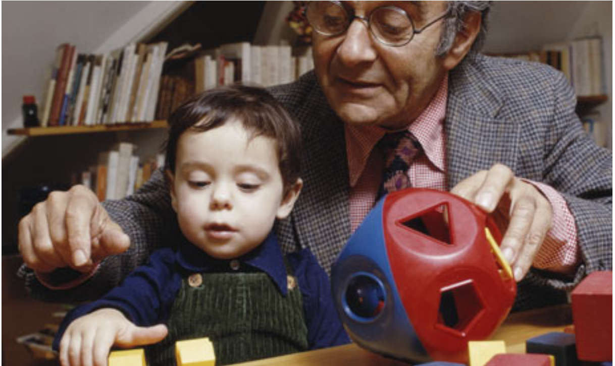
Jacob Bronowski (rechts im Bild) (1908-1974). Mathematiker, Biologe, Wissenschaftshistoriker.

Meine Antwort am selben Tag (3. Mai 2011):