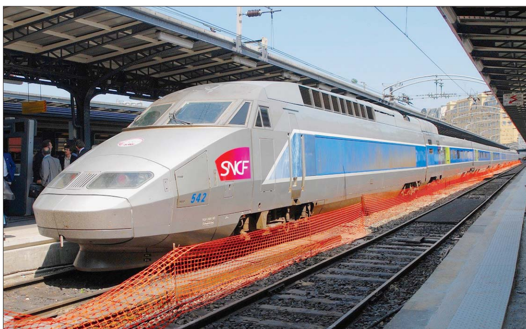
TGV EST Le nouveau train à grande vitesse relie Bâle à Paris en 3h20. Qui dit mieux?

Si le tracé n'a réservé que peu de difficultés géologiques à travers les vastes ondulations de l'est de la France, il fut plus malaisé de résoudre le casse-tête consistant à relier plusieurs villes - Reims, Châlons, Metz et Nancy - sises de part et d'autre de l'itinéraire et embranchées sur la ligne par des raccordements directs. La première phase était la plus facile à construire, sous l'angle du génie ci-