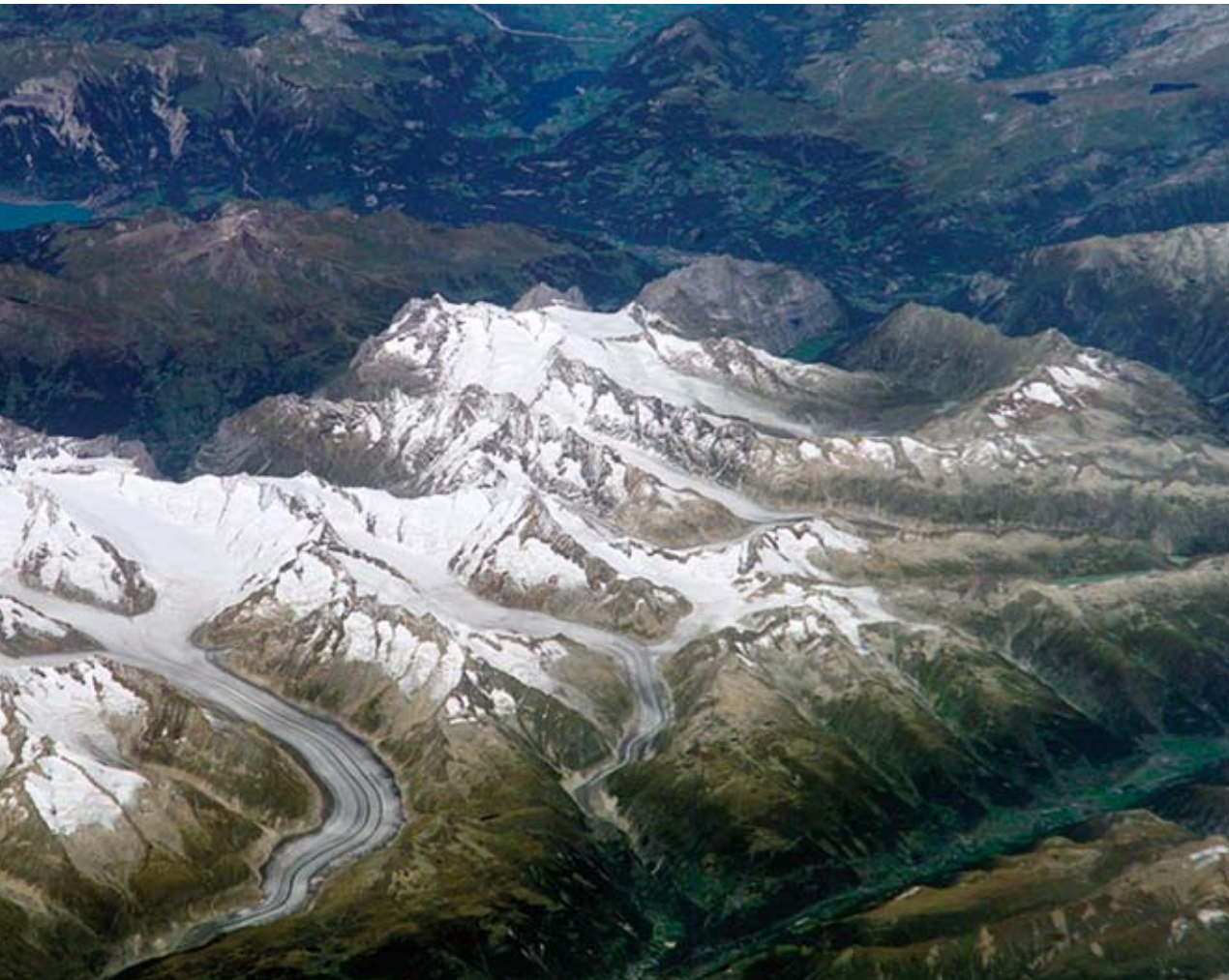
Der ungefähre Standort der Forschungsstation von Louis Agassiz auf der Mittelmoräne des Unteraargletschers heute; links der Finsteraargletscher, rechts der Lauteraargletscher