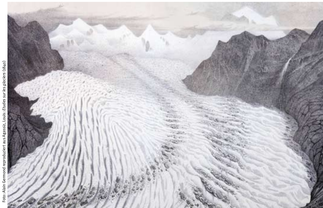
Foto: Alain Germond reproduziert aus Agassiz, Louis: Etudes sur les glaciers (1840)

Titelblatt der Etudes sur les Glaciers (1840) von Louis Agassiz: In diesem Werk zog er erstmals den zu der Zeit gewagten Schluss, dass das Schweizer Mittelland einst von Eis bedeckt war.