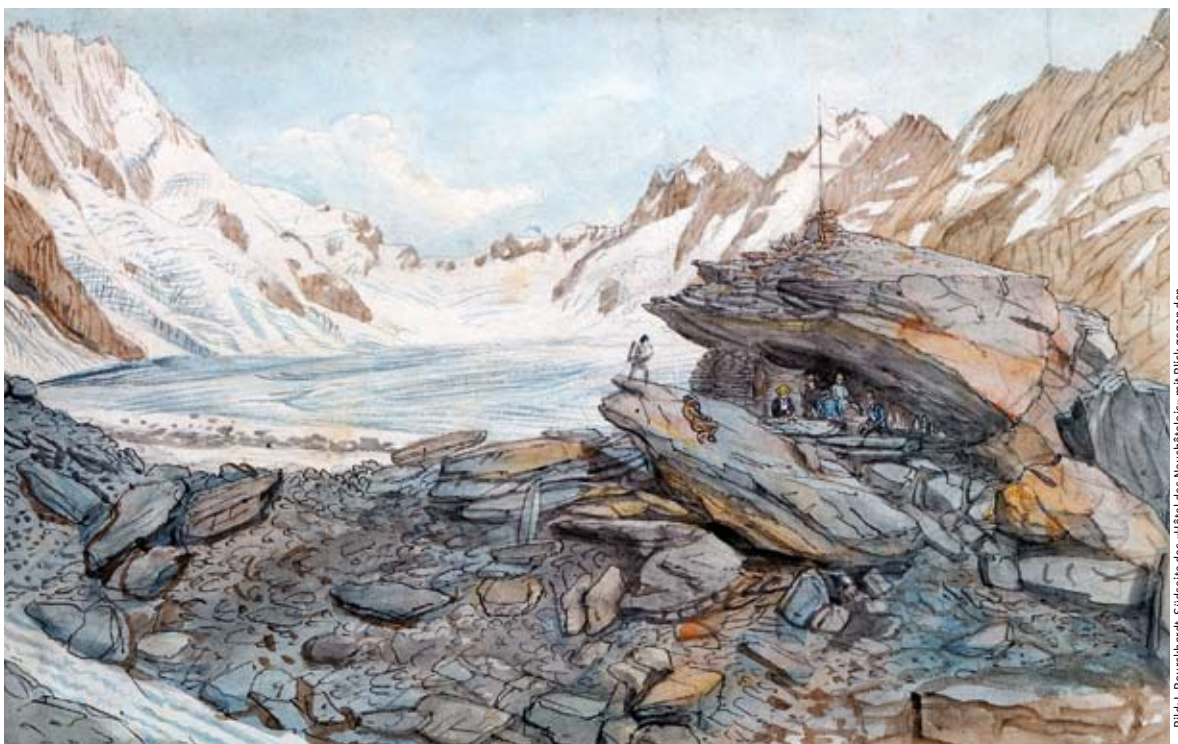
Bild: J. Bourckhardt, Südseite des «Hôtel des Neuchâtelois» mit Blick gegen den Lauteraargletscher. Bleistift, Feder, Aquarell (1840)

Forschungsstation von Louis Agassiz auf der Mittelmoräne des Unteraargletschers: Scherzhaft nannten die Wissenschaftler ihr Biwak «Hôtel des Neuchâtelois».